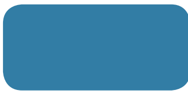
Pilkington Eclipse Advantage™ Arctic Blue Reflectorend glas met low E