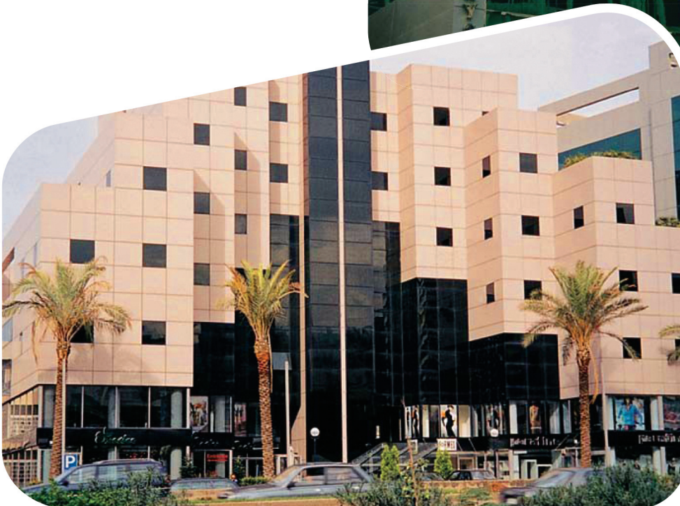
Pilkington Eclipse Advantage™ Grey