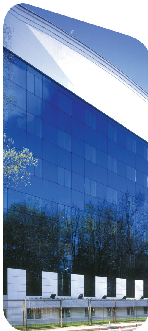
Pilkington Eclipse Advantage™ Arctic Blue

Doordat Pilkington Eclipse Advantage™ is voorzien van een pyrolitische coating in plaats van een magnetron coating, ontstaan er geen belangrijke veranderingen in de eigenschappen van het glas als gevolg van harden of buigen.