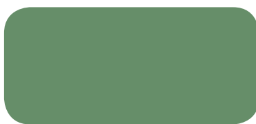
Pilkington Eclipse Advantage™ EverGreen Reflectorend glas met low E